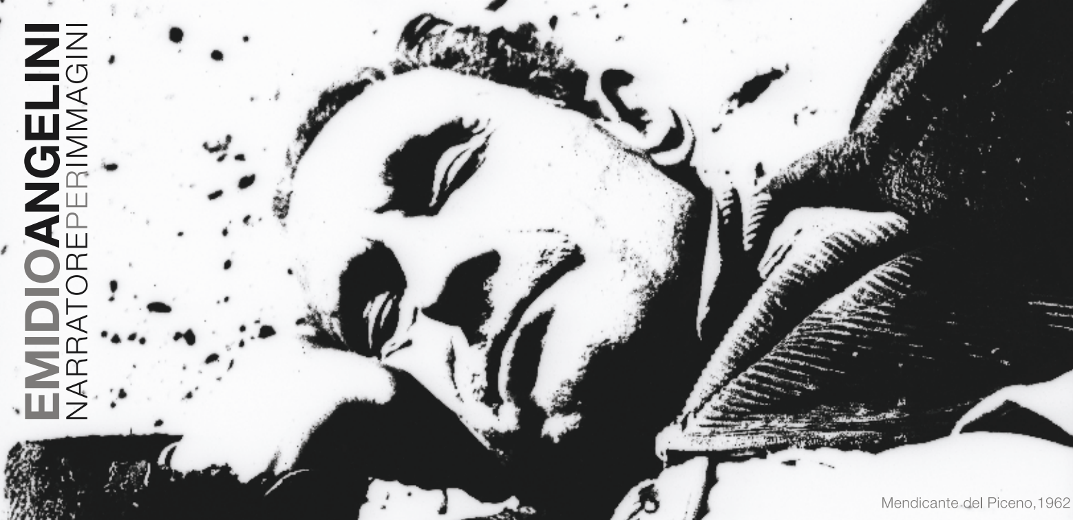
Mendicante del Piceno, 1962

La mostra ha l'obiettivo di offrire un significativo spaccato del percorso artistico di Emidio Angelini, ripercorrendo attraverso la sua esemplare e particolare ottica intellettuale, un lungo viaggio caratterizzato dalla costante ricerca e sperimentazione della tecnica fotografica e dalla capacità di ridurre le immagini alla voluta funzione narrativa. Dalle prime immagini degli anni '60, alle sequenze in fotomeccanica, dalle diverse opere premiate, tra cui il Premio NIEPCE Italiano 1965 per la fotografia assegnatogli da una giuria composta fra gli altri da Vittorini, Eco, Munari, Zavattini, all'illuminata attività didattica, fino ai lavori per la promozione del patrimonio artistico e culturale del territorio. L'esposizione vuole essere non solo un omaggio al fotografo che la critica italiana ha collocato tra i migliori assegnandogli, insieme ai grandi maestri della fotografia italiana tra cui Carmi, Colombo, Giacomelli, Scianna, la qualifica di " narratore per immagini ", ma anche un viaggio fotografico alla scoperta di Emidio Angelini che "con la sua opera" - scrivono Crocenzi e Valentini - "realizza quell'insegnamento illuministico secondo il quale non conosce l'umanità chi non conosce prima il suo vicino di casa".